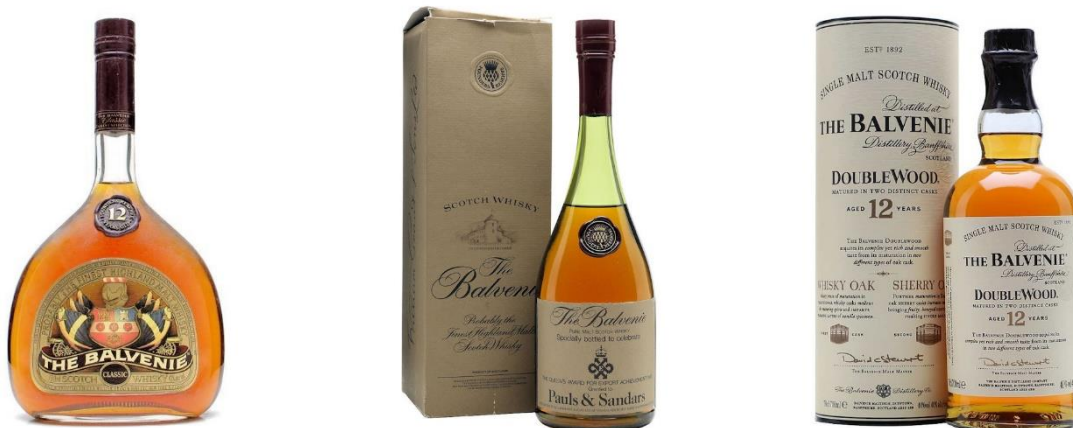
Bild: The Balvenie „Classic 12“ und der Founder’s Reserve in der alten Ausstattung (links) und der Balvenie 12 - DoubleWood im Design seit 1993 (Bild rechts).

Aus dem Jahr 1993 stammen auch die ersten mir bekannten Bottle Codes.