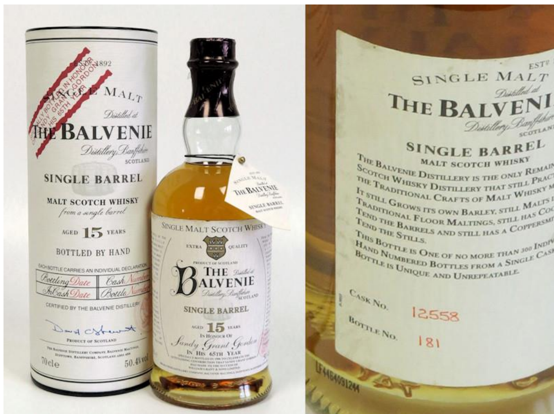
Bild: Eine ganz besondere Flasche Balvenie Single Barrel 15 Jahre. Der aufgedruckte Bottle-Code ist auf dem rechten Bild ganz unten links am Glasboden deutlich zu sehen.